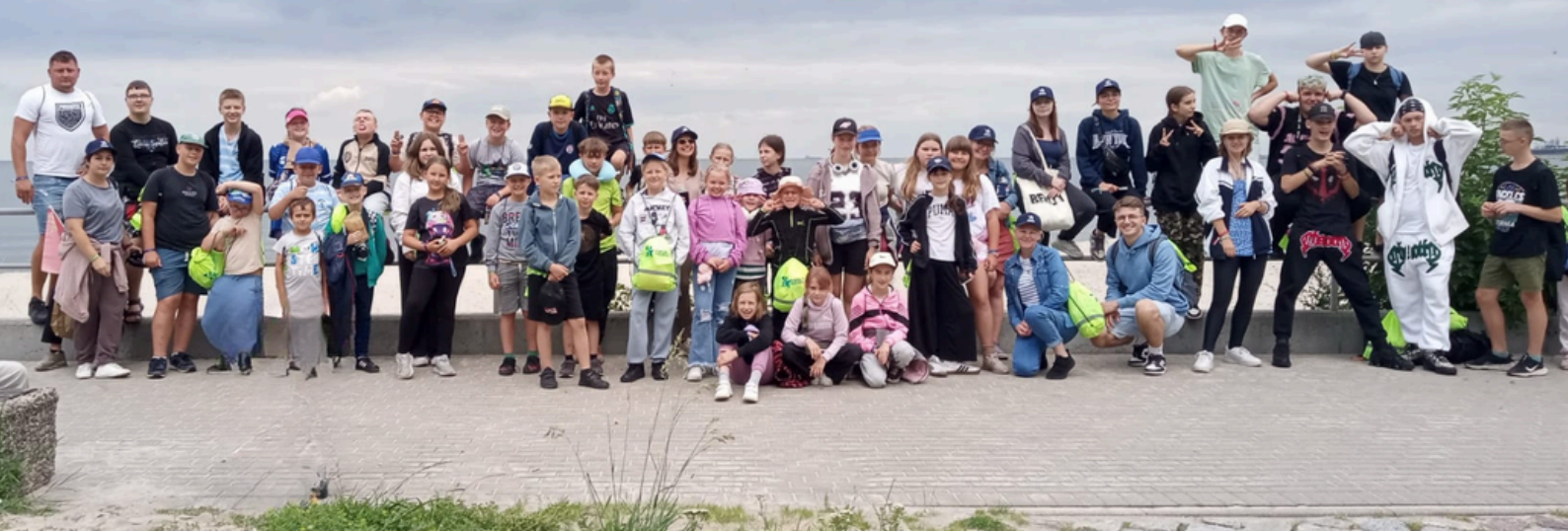
Wycieczka jednodniowa do Gdańska

Łącznie ze wszystkich form wsparcia wakacyjnego zorganizowanych przez Fundację POCIECHA skorzystały 23 świetlice, co przełożyło się na łączną liczbę 762 Dzieci.